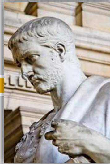
Римский юрист и государственный деятель III в. Учился у известного римского юриста Ульпиана.

б) диспозитивные нормы предписывают вариант поведения, но при этом представляют субъектам возможность в пределах законных средств урегулировать отношения по своему усмотрению.